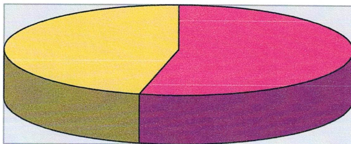
แผนภูมิแสดงร้อยละของจำนวนครั้งจำแนกตามวิธีการจัดซื้อจัดจ้าง ประจำปีงบประมาณ 2565

ตารางที่ 2 พบว่าในปีงบประมาณ 2565 องค์การบริหารส่วนตำบลนาบึง ได้ดำเนินการจัดซื้อจัดจ้างโดยใช้งบประมาณทั้งสิ้น 14,352,436.56 บาท พบว่าวิธีการจัดซื้อจัดจ้างที่ใช้งบประมาณสูงที่สุดคือวิธีคัดเลือก ใช้งบประมาณทั้งสิ้น 7,698,200.00 บาท คิดเป็นร้อยละ 53.64 รองลงมาคือวิธีเฉพาะเจาะจง ใช้งบประมาณทั้งสิ้นจำนวน 6,654,236.56 บาท คิดเป็นร้อยละ 46.36